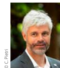
Laurent Wauquiez Président de la Région Auvergne-Rhône-Alpes