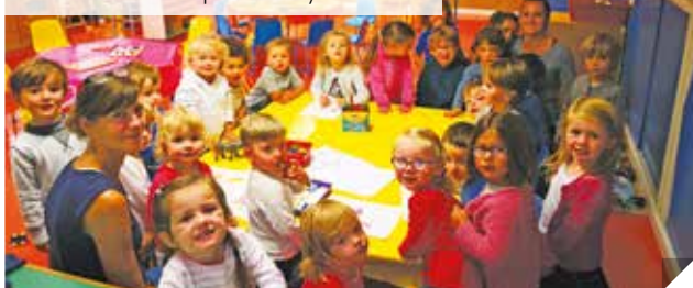
Classe de maternelle moyenne et grande section