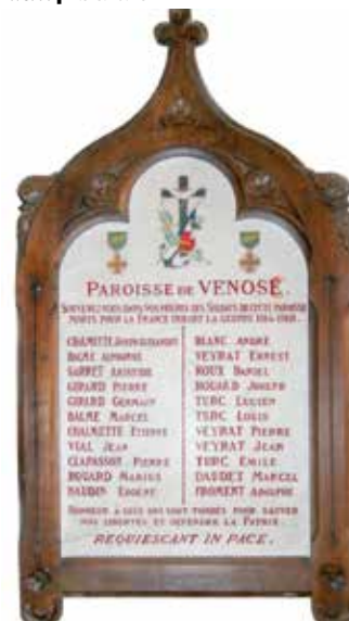
La plaque est visible à l'église de Venosc

Le 11 novembre 1918, un traité de paix est signé avec l'Allemagne. C'est la fin de quatre années de guerre. Vingt-trois jeunes de Venosc auront laissé leur vie dans ce conflit... | Michel Balme