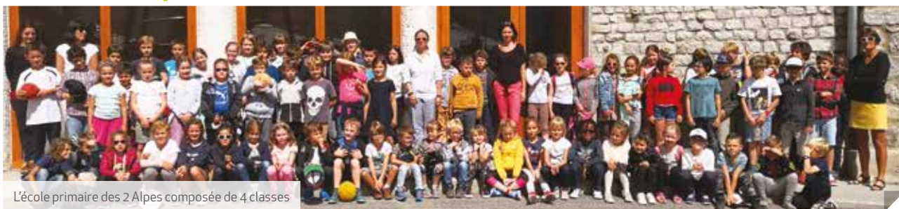
L'école primaire des 2 Alpes composée de 4 classes