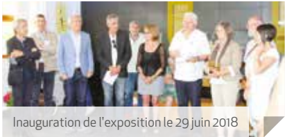
Inauguration de l'exposition le 29 juin 2018