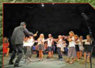
École d'art musical de Paris à Venosc